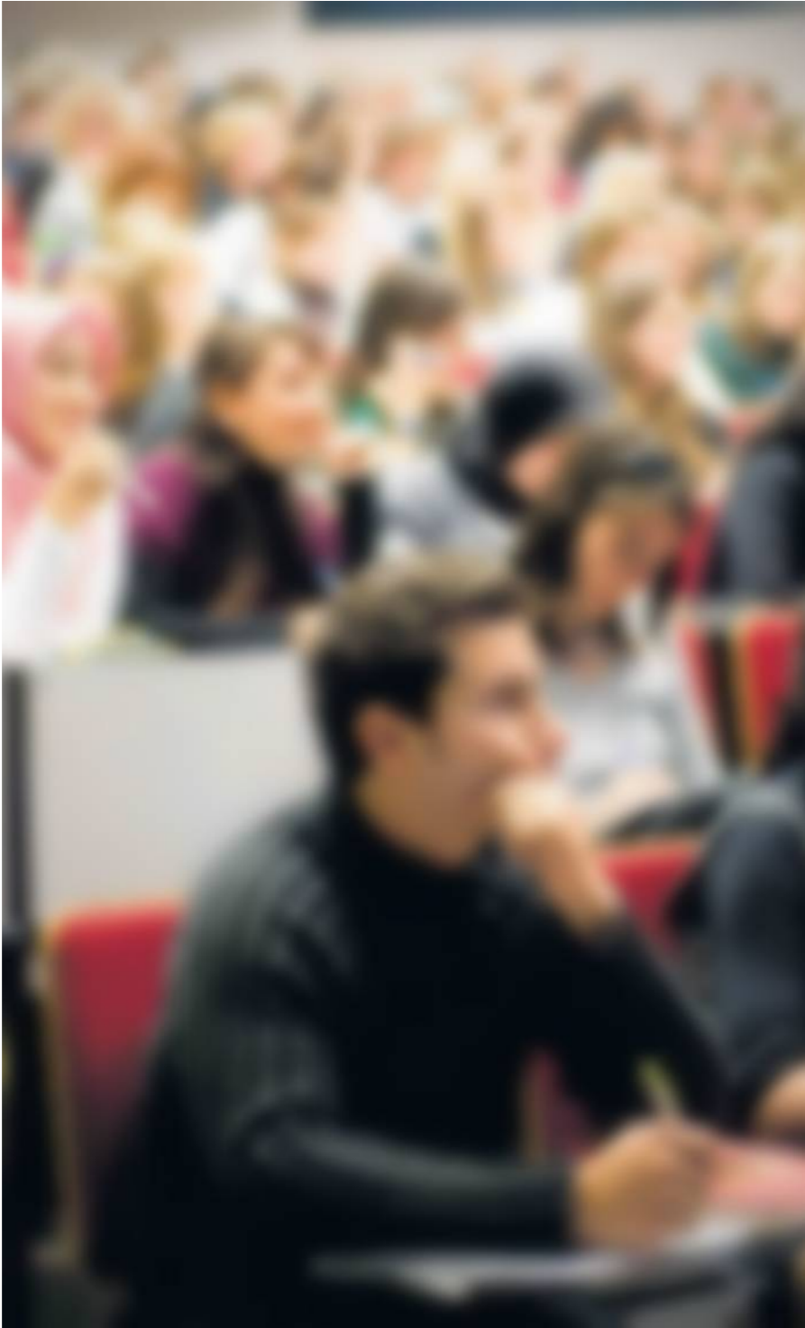
Een uitbreiding mag zich niet beperken tot het Brusselse lager en secundair onderwijs.

Het Nederlandstalig onderwijs in Brussel is een succesverhaal. Sinds de jaren negentig begonnen de Nederlandstalige kleuterscholen in Brussel uit hun voegen te barsten, door de massale instroom van Franstalige en anderstalige kleuters. Die vonden daarna steeds vlotter hun weg naar het Nederlandstalig lager onderwijs en daarna ook naar het secundair onderwijs. Momenteel gaat ruim 78 procent van de leerlingen uit het zesde leerjaar verder in een Nederlandstalige secundaire school in Brussel. Leerlingen die voor het Nederlandstalig onderwijs kiezen, kiezen ervoor om hun hele onderwijsloopbaan in het Nederlands te doorlopen. Het Nederlandstalig hoger onderwijs in Brussel vormt vervolgens de laatste etappe van hun schoolcarrière.